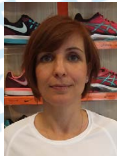
JAKAB ÉVA versenyközpont